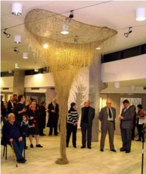
Wystawa czynna do 27 lutego 2011

Absolwentka warszawskiej Akademii Sztuk Pięknych. Dyplom na Wydziale Malarstwa (1958) oraz na Wydziale Tkaniny (1959). Udział w ponad 40 wystawach indywidualnych oraz w wielu wystawach zbiorowych w kraju i za granicą m.in. Biennale Tkaniny w Lozannie (1975-85 ), Triennale w Erfurcie (1978-82), Biennale miniatur w Meksyku (1986-90), Międzynarodowe Biennale Miniatur Tkackich, Szombathely, Węgry (1980-82/84/86/98/2003). Laureatka wielu nagród i wyróżnień m.in. I nagrody Krajowego Olimpijskiego Konkursu Sztuki, Warszawa ( 1969). Prace w zbiorach m.in. Muzeum Narodowego, Warszawa oraz Poznań; Muzeum Włókiennictwa, Łódź; Muzeum Kultury Fizycznej i Turystyki oraz w Muzeum Olimpijskim, Lozanna oraz w licznych kolekcjach prywatnych.